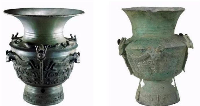
图 1 安徽阜南出土的龙虎尊（1957 年出土） 图 2 三星堆遗址出土龙虎尊（1986 年出土）