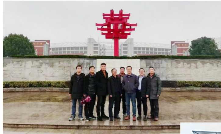
光山二高走进华师一附中