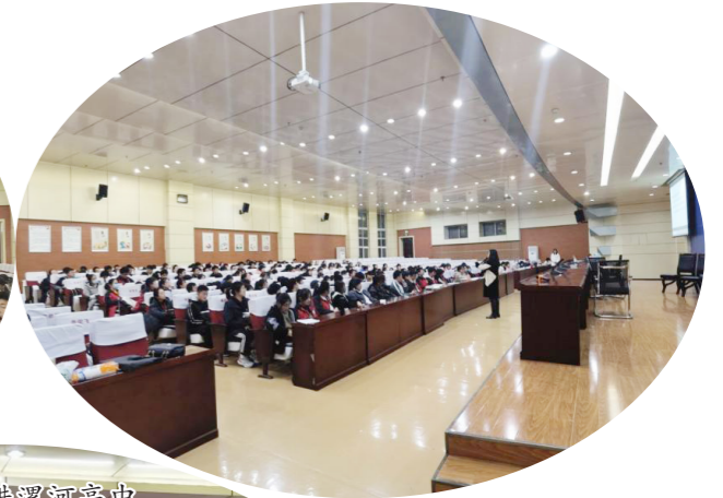
名师走进漯河高中