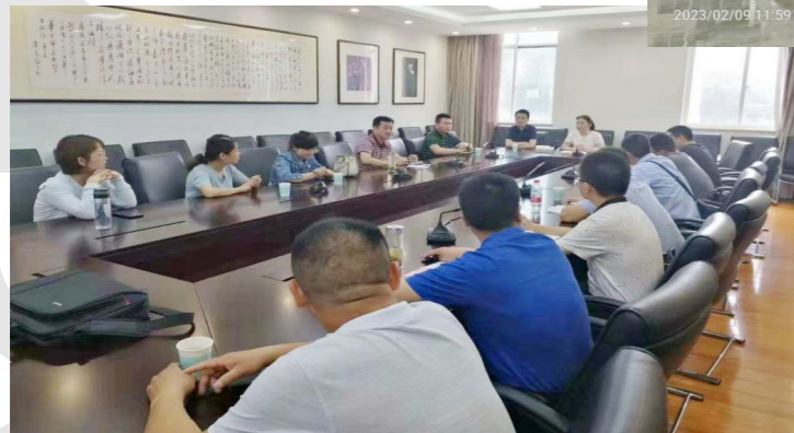
光山二高走进华中师范大学考试研究院