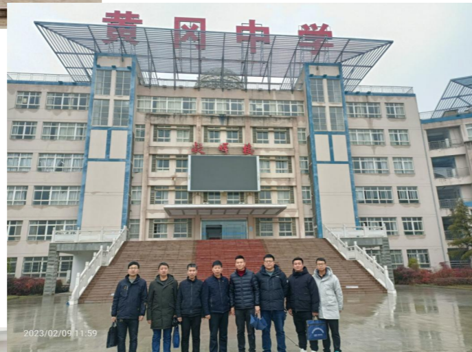
汝州一高走进黄冈中学